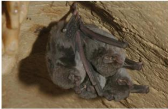
Minioptères de Schreibers.