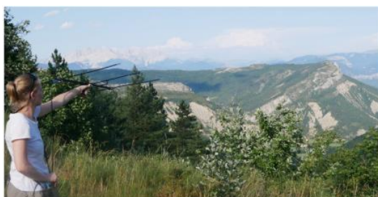
Vue d'ensemble de la zone d'étude.

Dans le cadre de la construction du parc photovoltaïque de Grand Bois sur la commune de l'Épine (05), des mesures compensatoires ont été mises en œuvre par le Groupe Chiroptères de Provence (GCP) et la Société Alpine de Protection de la Nature (SAPN). En 2024, salariés et bénévoles du GCP étaient ainsi réunis du 5 au 14 août afin de rechercher des gîtes forestiers par télémétrie. Les résultats ont mis en évidence la diversité des gîtes (arboricoles, rupestre et bâti) utilisés par les Chiroptères forestiers et l'importance de conserver les mosaïques d'habitats.