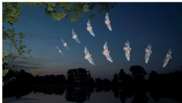
Utilisation des zones humides et de la Trame Turquoise par les chauves-souris.

Page du projet Rest-Chir'Eau sur le site de la Tour du Valat,