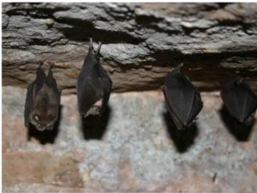
Petit Rhinolophe.

Le Syndicat Mixte Asse Bléone gère le site Natura 2000 de l'Asse depuis 2013, sur lequel se trouve une espèce de chauve-souris patrimoniale et menacée : le Petit Rhinolophe.