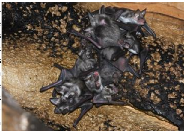
Essaim de jeunes Petits/Grands Murins observés en 2023 dans la grotte.

Un Arrêté Préfectoral de Protection de Biotope (APPB) a vu le jour en mars 2022 afin de protéger une grotte accueillant différentes espèces de chauves-souris, notamment une colonie de mise-bas de Petits/Grands Murins, soumise à une forte fréquentation humaine. Les actions menées depuis 2021 proposées par le plan de gestion ont permis de sécuriser le gîte et ainsi de stabiliser les populations de chauves-souris au sein de la grotte. Cette mise en protection du gîte semble être très positive car la mise-bas y a été depuis confirmée pour le Petit/Grand Murin, et le retour d'une colonie de Minioptère de Schreibers (10 à 20 individus) a été observé sur deux années consécutives après la fermeture de la cavité ; cette espèce n'avait plus été observée depuis 2019 (hors individus isolés) !