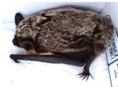
Sérotine bicolore

Depuis sa création en 1995, le Groupe Chiroptères de Provence œuvre pour la préservation et la conservation des Chiroptères en région Provence-Alpes-Côte d'Azur. Une de ses missions est l'amélioration des connaissances. Ainsi, avec la participation de nombreux bénévoles et partenaires, de nouveaux sites à chauves-souris et, localement, de nouvelles espèces, sont découverts. Depuis 2021, des découvertes aussi inattendues qu'encourageantes ont été réalisées dans la région. Cet article vise à présenter les plus remarquables.