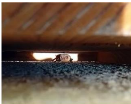
Gîtes à Chiroptères sur un logement d'astreinte.

En 2021, RTE s'est engagé dans une expérimentation inédite en équipant des logements d'astreinte de Sainte-Tulle, Cabriès, Port-de-Bouc et Toulon de 80 nichoirs à chauves-souris dans le but de réduire les nuisances occasionnées par les moustiques et de sensibiliser les habitants à la préservation de ces espèces fragiles. Un an après la pose des nichoirs, deux colonies de reproduction ont pu y être observées !