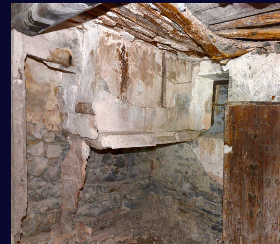
Gîte de Notre-Dame de Lauzière, le Brusquet. Avant travaux / Après travaux.