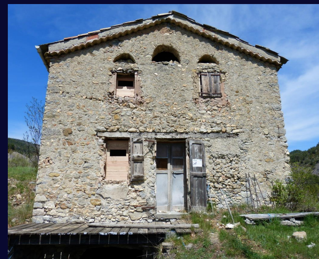
Gîte de Sévigné après rénovation, Draix