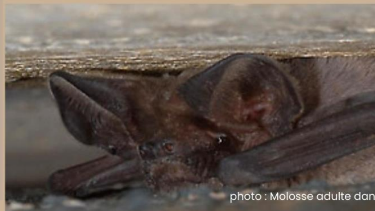
photo : Molosse adulte dans un joint de dilatation

Si une chauve-souris entre dans une habitation, il est recommandé de laisser la fenêtre ouverte, d'éteindre la lumière et de sortir calmement de la pièce. La chauve-souris sortira toute seule au bout de quelques minutes.